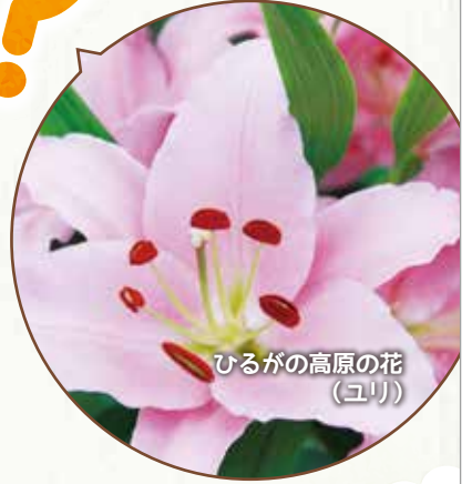
ひるがの高原の花 (ユリ)