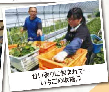
甘い香りに包まれて...いちごの収穫♪

移住された方、現地で働く方からは 「アットホームな環境で働きやすく、達成感がある!」 「大変な作業も多いけれど、青空の下で働けて気持ちが良い!」 という声が届いています。