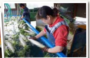
だいこんの仕上げ洗い★