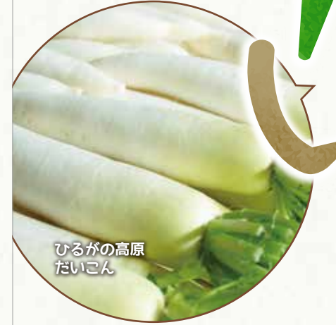
ひるがの高原だいこん