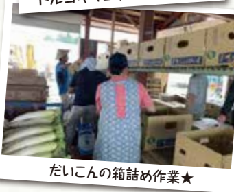
だいこんの箱詰め作業★