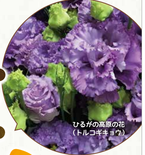
ひるがの高原の花 (トルコギキョウ)