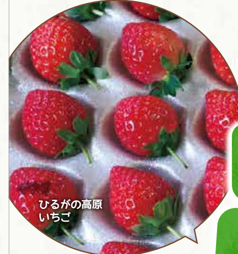
ひるがの高原いちご