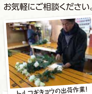
トルコギキョウの出荷作業!